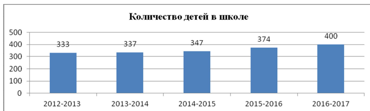
Диаграмма 1. Численность учащихся в школе

Средняя наполняемость в классах по школе 22 ученика: